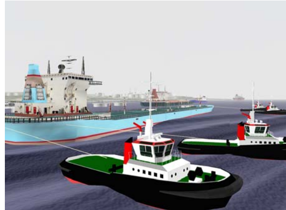
Modelo virtual de Remolcadores